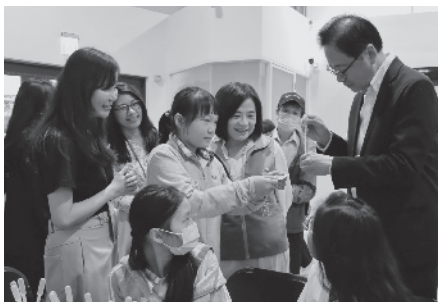
· 在科普阅读探究热血教师的带领下，桃园市长张善政（后排右一）与张荣发基金会执行长钟德美（后排右二）和学童一起学习香精调制。

重点学校分头并进，实践多面向的科普教育：例如慈文国小办理的「行动书车趴趴GO」，透过行动书车与科普书籍的投放，解决学校端图书资源更新不足的问题。同德国小的「科普SEL探索营」，则是设计沉浸式五感体验课程，包含定