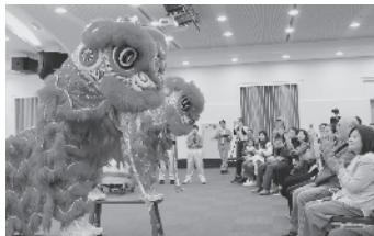
·「2026年張榮發基金會藝術季」由野柳國小鼓獅隊揭開序幕，帶來傳統廣東醒獅演出。

代的文化軟實力奠定基礎；在如今眾聲喧嘩的文化版圖上，連結不同族群與世代的價值認同，亦在日復一日的的生活步調中，找回最初接觸藝術的那份悸動。節目詳情與免費報名資訊，請上「張榮發基金會」臉書或活動官網查詢。