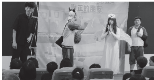
· 張榮發基金會小劇場自2020年迄今，六年來已入校巡演逾百場，劇情貼近學童生活日常人際關係，受到師生高度肯定。

林國小、 青山國中 小、豐珠 中學、瑞 亭國小、 吉慶國小 以及三和 國小的師 生們，不 只走出校