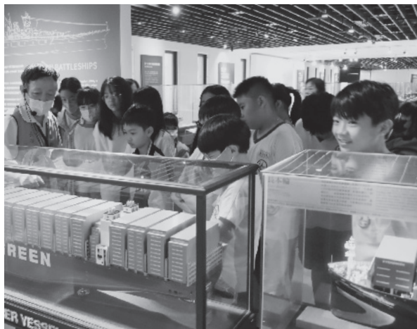
· 張榮發基金會「科普好好玩」邀桃園師生參訪長榮海事博物館，並安排專業導覽。