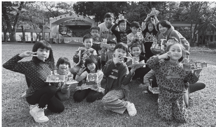
· 本会赞助「新北市艺术深耕教学计画」之民国国小学生开心展示木艺课成果作品。

本会甫於去年底三度荣获教育部「艺术教育贡献奖」，新年刚开春再次投入钜资，协助新北市七十所国小深耕艺文教育，并且邀请艺术家驻校，与新北各国小老师合作发展踢踏舞、木艺、小提琴等丰富的艺术特色课程。 本会执行长