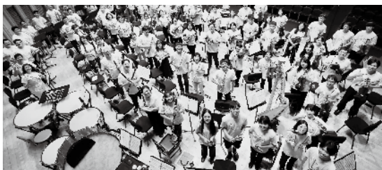
·本会独立营运长荣交响乐团23年，不仅自办多场公益音乐会，并设立「长荣交响音乐营」，迄今集训480位非职业爱乐者。

事迹包括以一己之力独立营运专业的长荣交响乐团达二十三年，并自办多场大型音乐会，邀请公益团体三万三千人次免费聆听，另建置超过四百万观看次数的一「长荣好古典」YT频道。