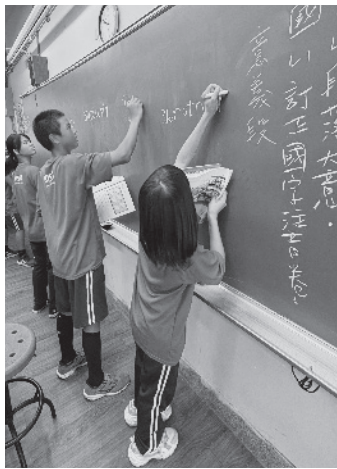
· 本会提供经费增聘花莲县三民国中教学人力，巩固学生基础学力。

师，跨校带领其他四所国中建立英文社群，共同提升英语教学效能。今年再度延续偏乡教育协助计画，不仅希望携手偏乡师生共同努力，也是本会长期待推动教育公益使命的具体实践，让每位孩子都有机会迎接更美好的未来。