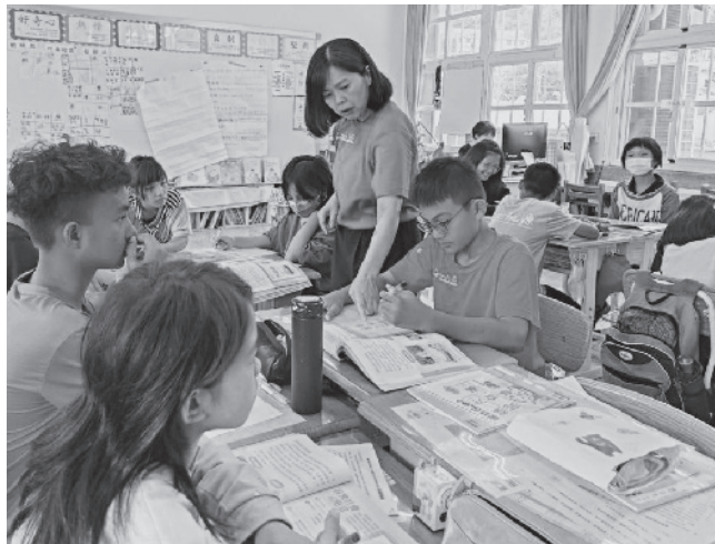
· 本会协助台东县桃源国小补足国语教师人力，平衡偏乡学习资源。