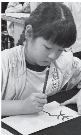
· 學生練習書寫「孝」字體會孝順意涵。

道、書寫的習慣以及運筆的思路，這都是思考、人格及精神的延伸。從書法教育觀察孩子的書體，也許是孩子在多元智能啟發的另類教學。古人云：「定、靜、安、慮、得」，書法教育更是一種生活哲學，讓孩子從培養寫字的樂趣，獲得學習的新動力。